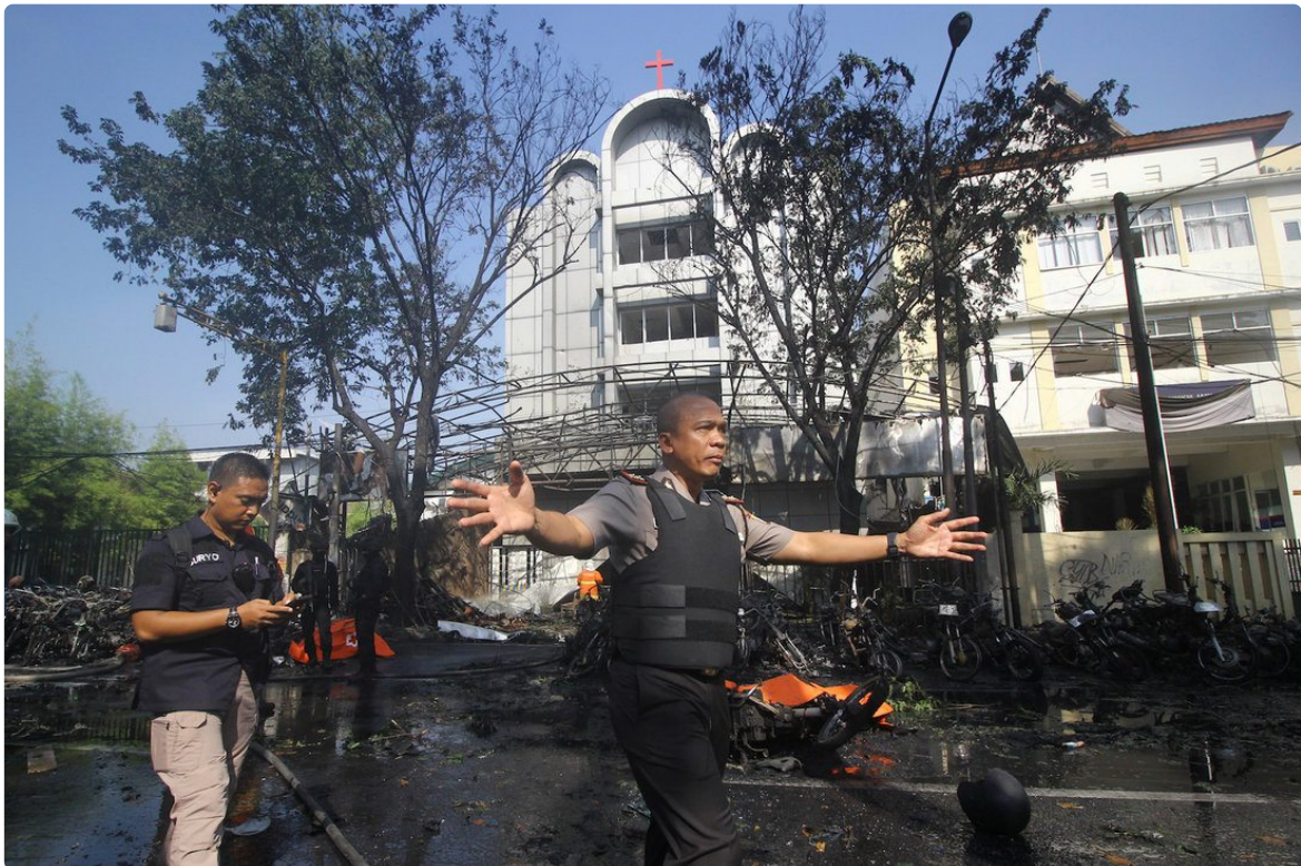
Polisi di depan Gereja Pantekosta Pusat Surabaya (GPPS), salah satu target pengeboman terorisme pada 2018. (Foto: Moch Asim ).

“Strategi kontra-terorisme yang dapat dilakukan pemerintah dalam negeri meliputi beberapa aspek,” tambah Thomas. Di sini Thomas menekankan pentingnya insentif positif. Pemerintah harus memastikan bahwa kesejahteraan ekonomi masyarakat dapat terpenuhi.