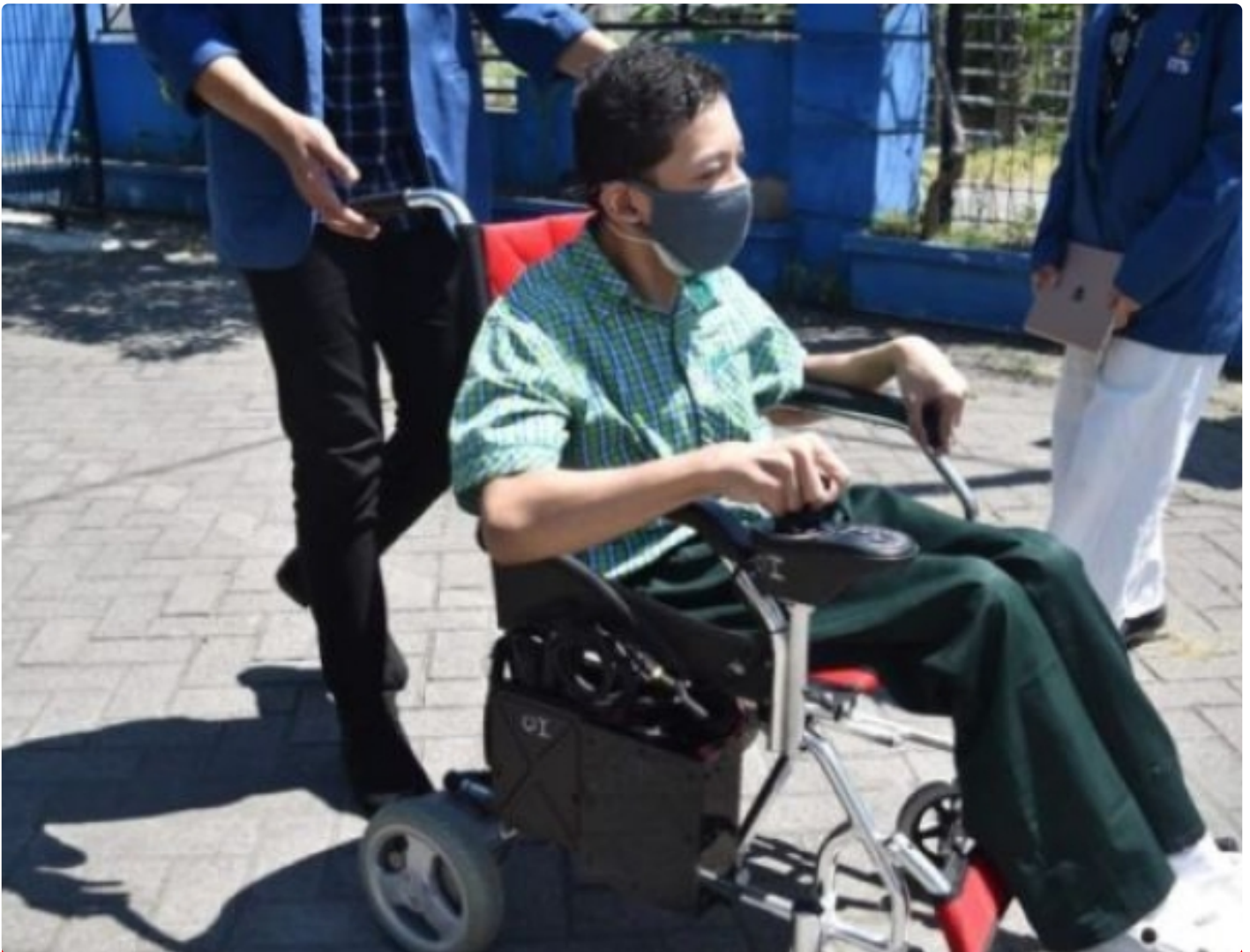
Kursi roda elektrik untuk disabilitas karya mahasiswa Departemen Teknik Biomedik ITS

SURABAYA – Peminatan Teknologi Asistif dan Rehabilitasi Medika merupakan satu dari empat bidang peminatan unggulan di Departemen Teknik Biomedik Institut Teknologi Sepuluh Nopember (ITS). Bidang ilmu ini berfokus pada teknologi medis yang mampu mendukung aktivitas para penyandang disabilitas